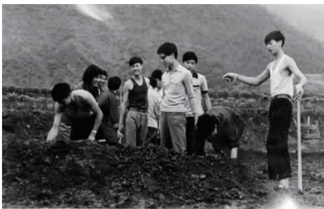
考古发掘中的川大同学

立足西南,放眼世界,是新时代赋予川大考古的新使命。川大考古与哈佛大学、圣路易斯华盛顿大学、华盛顿州立大学、英属哥伦比亚大学、剑桥大学、艾克赛特大学、哥本哈根大学、九州大学以及台湾大学、台湾“中研院”史语所、香港中文大学等建立了广泛的学术合作,开展学者互访、实验室合作和联合培养学生。通过国家留学基金管理委员会“中国政府奖学金”和自主设立的“‘一带一路’奖学金”,招收来自斯里兰卡、伊朗、老挝、俄罗斯、泰国、马来西亚等国家留学生,并在斯里兰卡、老挝等国开展田野考古工作,成为国家布局的东南亚、南亚考古和文化遗产海外留学生培养基地。