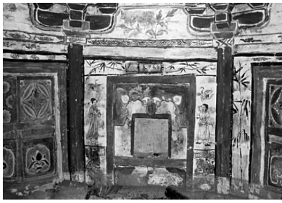
图3 陕西省甘泉县柳河渠湾村金墓 东北壁彩绘

河南荥阳槐西宋墓壁画内容丰富,包括居家图、梳妆图、备宴图、出行图、孝行图等。其中西壁下部图绘墓主夫妇与僧侣的礼佛焚香图,反映宋代士庶之家礼佛敬香的场景。图中墓主夫妇相对而坐,目视前方,中间一张方桌,桌上放置茶盏两只,杯形香炉一座,炉上香烟一缕,袅袅上升。图像左半部图绘身穿袈裟的僧侣四人,一人双手托莲,其余三人双手击钹(图4)。 ① 相同的杯式炉,还可见于河南巩义米河半个店北宋石棺线刻和山西沁水县宋墓雕砖。其中山西沁水县宋墓砖雕焚香图,刻有一位身穿长袍的男子端坐椅中,前方香几上放置一杯式炉。 ② 美国克利夫兰艺术博物馆藏北宋赵光辅《番王礼佛图》中一位供养人也手捧此类香炉。