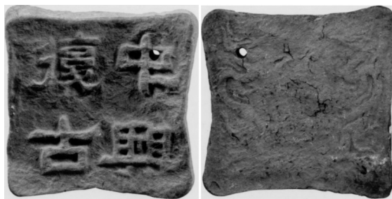
图9 江苏武进村前蒋塘宋墓出土 “中兴复古”香饼

以香礼佛崇道、敬神祀天是宋人燃香的另一种精神寄托。“焚香祝天”是宋人将熏香雅事与生活诉求相结合的一项非常普及的社会活动。江苏武进村前蒋塘宋墓中曾出土过一方刻有“中兴复古”四字的香饼，系制作和使用于南宋时期，由此传达出时人在焚香祝天时祈求皇朝中兴、文化昌隆的美好祝愿，曲折地反映出南宋时期偏安江左、强敌环伺的政治环境下宋代士民内心的深切盼望（图9）。