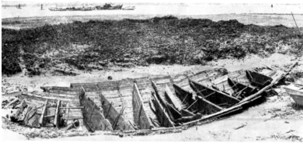
图 10 泉州湾宋代海船全貌

至熙宁年间,仅广州市舶司购买并纲运至京师的乳香就达三十四万八千六百七十三斤。《宋会要辑稿》载,南宋绍兴二十五年(1155年)从占城朝贡的商品中,香料包括沉香在内多达十三种,其中仅乌里香就多达“五五零二零斤”。 ① 据宋代洪刍《香谱》和赵汝适《诸蕃志》等资料记载,当时进口的香料达一百多种,其中常见的有乳香、龙涎香、龙脑香、沉香、檀香、白檀香、丁香、苏合香、麝香、木香、茴香、藿香等数十种。香料的大宗进口,直到元代仍不衰竭。