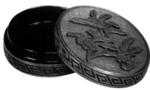
图 7.2 北京故宫博物院藏剔红桂花香盒