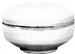
图 7.1 河北易县静志寺舍利塔塔基出土定窑白瓷盒

“香盛”即香盒,盛香之具,多为瓷质,其次有漆木、金银,造型小巧精致,尺寸大小与人体手掌契合,与香炉相伴而出,如山西太原小井峪宋墓瓷盒 ② 、河北易县静志寺舍利塔塔基出土的定窑白瓷盒 ③ 、江西德安县龙机厂出土的青白釉瓜棱瓷盒 ④ 、江苏南京江宁建中村南宋绍兴二十五年墓出土水晶盖盒和牙角质盖盒 ⑤ 以及故宫博物院藏宋剔红桂花香盒等 ⑥ 均生动展示了这类随身的香具(图7)。四川泸州博物馆藏宋墓燃香石刻当中,也多次出现香盒造型。香几则为木质,既能安置香炉,也可装点深院幽庭。“香壶”盛放“香匙”“香箸”,三者合为一体(图8)。 ⑦