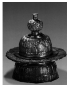
图6.1 四川彭州金银器 窖藏银质香炉

考古出土和传世的香具主要分为香炉、香盒、香箸、香几等,其中香炉作为燃香的最主要工具有着最为丰富的式样形态。例如,发现于四川彭州的宋代金银器窖藏银质香炉和浙江宁波天封塔地宫出土的南宋莲花纹银制大香炉 ⑤ 、安徽省博物馆藏北宋元祐二年墓出土绿釉狻猊 ⑥ 、江西吉水南宋墓出土铜制香鸭 ⑦ 、安徽合肥包绶墓出土青白釉博山炉 ⑧ 等,都是宋代香炉流行的式样(图6)。