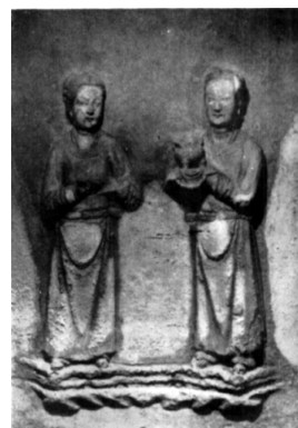
图2 四川彭山虞公著夫妻合葬墓西室东壁后龕侍香图