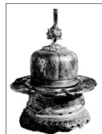
图6.2 浙江宁波天封塔 地宫出土的南宋莲花纹 银制大香炉