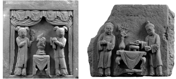
图5 泸州市博物馆藏宋墓石刻熏香 图号 L0025、02434

编号 L0025 的狮子出香位于帷幔正中的矮几上,左右侍女一持瓶花、一捧香合。此种香炉以圆台做炉身,莲蓬为盖,香烟从兽口散发。安徽省博物馆藏北宋元祐二年墓出土绿釉狻猊与之相仿。02434号熏香图中间雕刻一张方香几,上置一简洁的敞口式样香炉和胆瓶插花,两侧身穿长褙的男侍一人手拿香合,一人拈香入炉(图5)。02491号石刻熏香图与之相似。02432号石刻中一位侍女手捧龟形香炉,龟口香烟一缕缓缓升起,另一侍女手捧仙鹤,鹤口衔锦书“龟鹤齐寿”。 ④