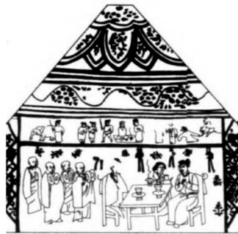
图4 河南荥阳槐西宋墓西壁示意图

河南荥阳槐西宋墓壁画内容丰富,包括居家图、梳妆图、备宴图、出行图、孝行图等。其中西壁下部图绘墓主夫妇与僧侣的礼佛焚香图,反映宋代士庶之家礼佛敬香的场景。图中墓主夫妇相对而坐,目视前方,中间一张方桌,桌上放置茶盏两只,杯形香炉一座,炉上香烟一缕,袅袅上升。图像左半部图绘身穿袈裟的僧侣四人,一人双手托莲,其余三人双手击钹(图4)。 ① 相同的杯式炉,还可见于河南巩义米河半个店北宋石棺线刻和山西沁水县宋墓雕砖。其中山西沁水县宋墓砖雕焚香图,刻有一位身穿长袍的男子端坐椅中,前方香几上放置一杯式炉。 ② 美国克利夫兰艺术博物馆藏北宋赵光辅《番王礼佛图》中一位供养人也手捧此类香炉。