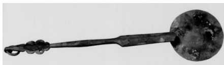
图 8 福建福州茶园山南宋端平二年墓出土铜香匙