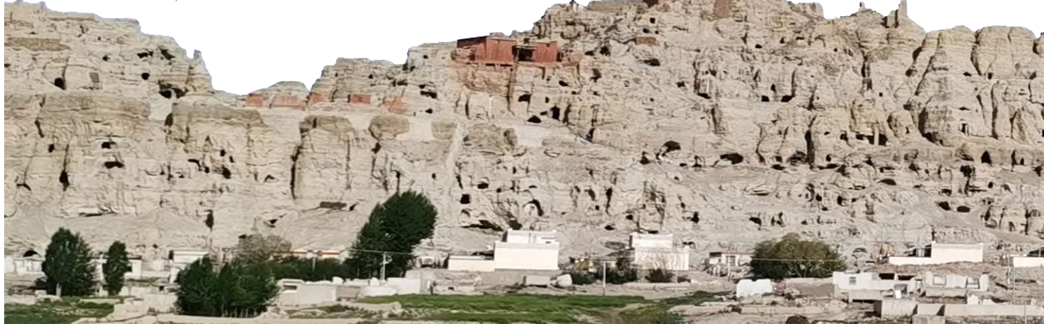
皮央石窟外景

东嘎2号窟平面形制亦为单室方形窟，顶部为一四重同心圆式立体套斗顶。该窟四壁共绘制菩萨达