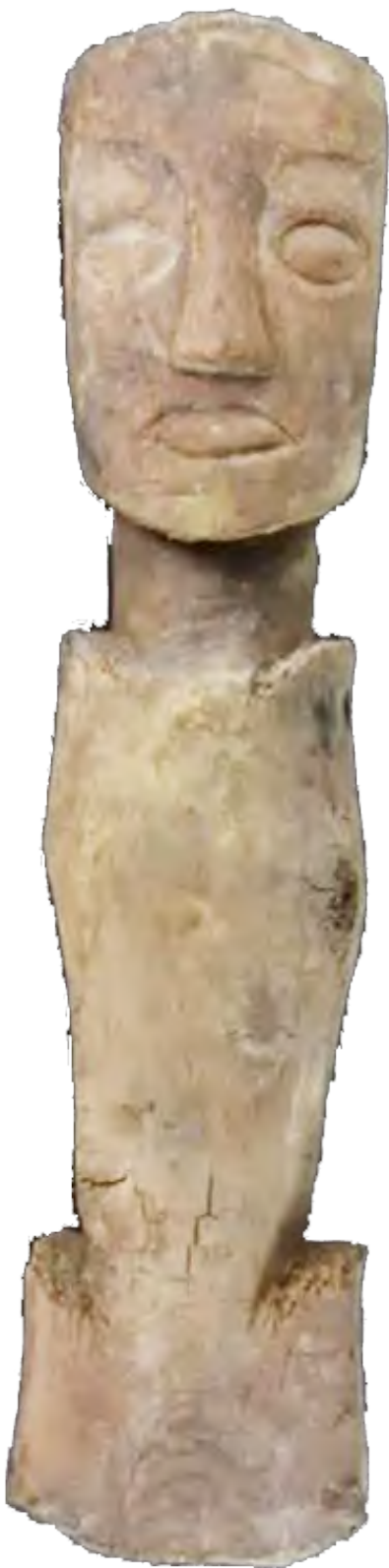
桑达隆果墓地出土的木俑

形制与临近的曲踏墓地、故如甲木墓地，以及印度马拉里墓地、尼泊尔桑宗墓地出土的金、银面饰形制相同或相近。这类金、银面具发现数量稀少，集中分布在喜马拉雅山脉西段南、北两麓，其年代从公元前 300 年延续至公元 500 年。