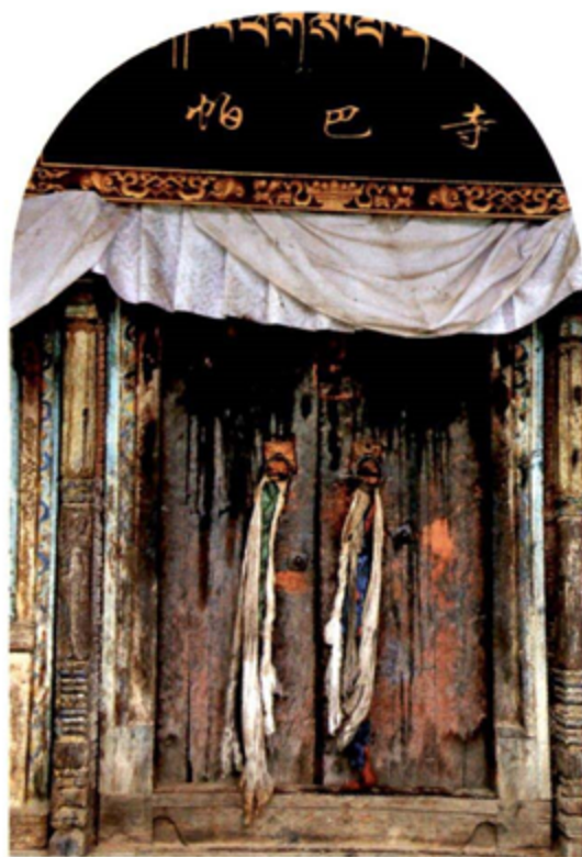
▲ 帕巴寺是吐蕃时期松赞干布迎娶尼泊尔尺尊公主进藏时所建的寺庙之一，位于西藏日喀则市吉隆县吉隆镇，其建筑式样具有较典型的尼泊尔风格。

现代考古学进入到藏学研究领域，为青藏高原“百万年的人类史、一万年的文化史、五千年的文明史”研究都带来了史无前例的重大突破，从根本上改变了传统的青藏高原文明史观。其中一个十分重要的收获，是通过几代考古工作者不断地努力，相继在青藏高原发现了一大批和高原古代人类族群之间、高原各区域之间，甚至更为遥远的与今天中国版图之外的域外文明之间相互交往、交流和交融的考古遗存（考古学上对遗迹和遗物的统称），从而有力地证明早在史前时代伊始，高原上的古代先民们筚路蓝缕，便已经开始从物种的引进与传播、动物的驯化与繁殖、适合于高原自然生态和环境的生产技术与生产方式的改进等诸多方面，同外界有了广泛的交流。