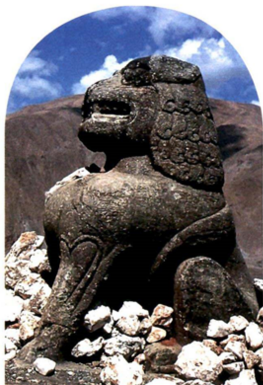
▲ 西藏琼结吐蕃藏王墓前的石狮。