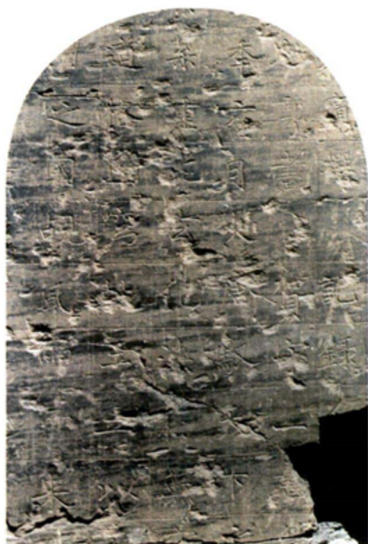
▲ 西藏吉隆《大唐天竺使之铭》摩崖碑铭局部。