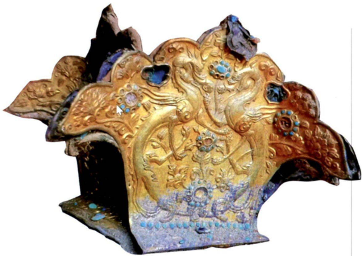
▲ 青海泉沟一号墓中出土的王冠。

进入到早期金属器时代，青藏高原各地考古发现的岩画、大石遗迹、青铜兵器、装饰品等遗物，均标志着此时的高原古代民族已经和北方草原、西南山地、中原和长江流域的古代文明之间建立了密切的文化联系。不仅高原区域之间的交通线路可能已经初具雏形，甚至远程贸易也已经开始。从考古发现来看，唐代吐蕃王朝是高原丝绸之路发展最为迅猛的时期。吐蕃考古新发现当中，既有和丝绸之路这个概念直接相关的大量汉晋、唐代的丝绸残片，甚至发现了与汉景帝阳陵随葬品当中品质相同的内地茶叶的遗物。在西藏西部和青海等地出土有欧亚大陆和海上贸易中常见的宝石、珠玉、香料、带柄青铜镜等装饰品，出土金银器中有不少系仿制中亚地区波斯萨珊王朝和粟特系统的金银器；还有最能体现欧亚草原文化色彩的、大量装饰在金银器上的有翼神兽、大角动物、马与骑手等纹饰图案。在一些文献记载的重要交通要道上，发现了和